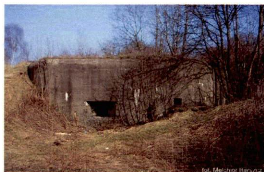
Zdjęcie nr 16. Widok od południa