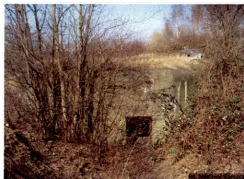
Zdjęcie nr 15. Widok od południowo-wschodu