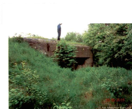
Zdjęcie nr 114. Widok od zachodu