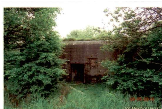
Zdjęcie nr 113. Wejście od północy